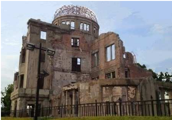
被爆の実態を残す広島原爆ドーム